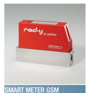
SMART METER GSM

Die thermischen Massemesser überzeugen durch hohe Genauigkeit und Dichtheit.